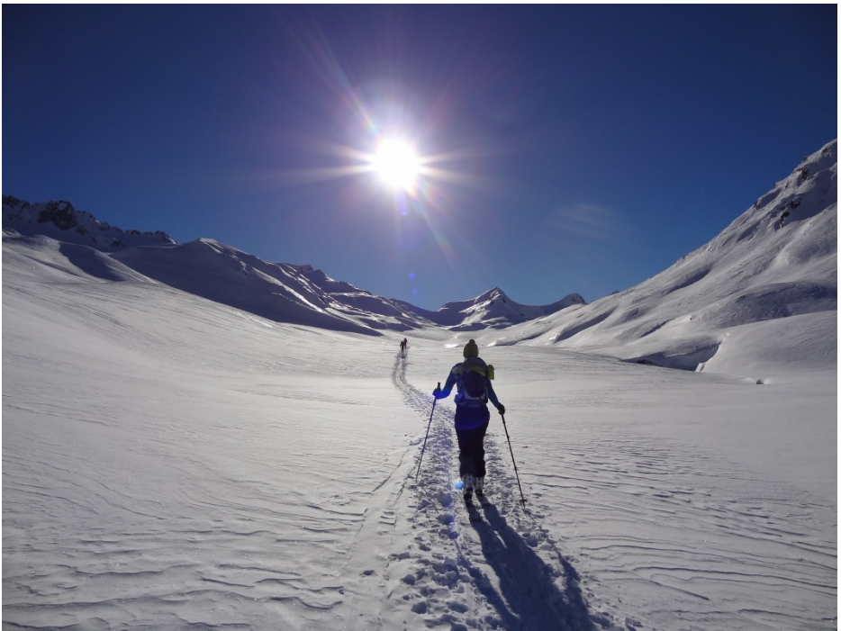
Skihohtour Andermatt