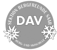
Sektion Bergfreunde Saar