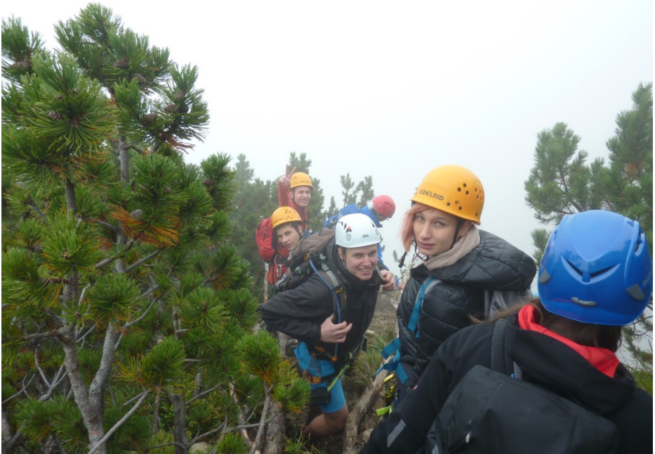
Vorm Einstieg in den Salewa-Klettersteig.