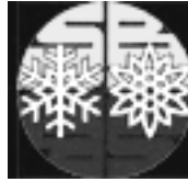
Saarl. Bergsteiger- und Skiläuferbund