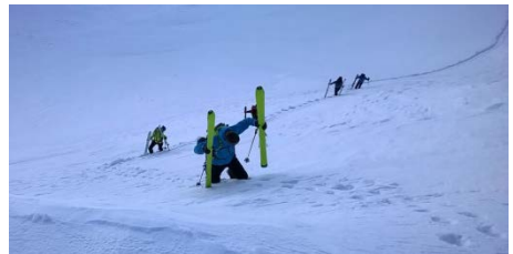
5.-8.01.15 Andermatt