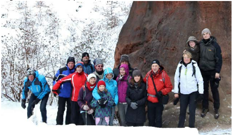
Abspeckwanderung 2014